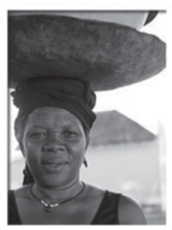
As lavadeiras, uma presença constante na paisagem são-tomense, vista geral da cidade de São Tomé e mulher que regressa do Mercado. Pescadores junto à Lagoa Azul.